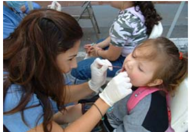
Fotos de las ferias de salud del 2004-2007.