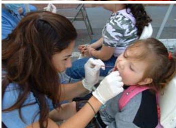
Photos from 2004 -2007 health fairs.